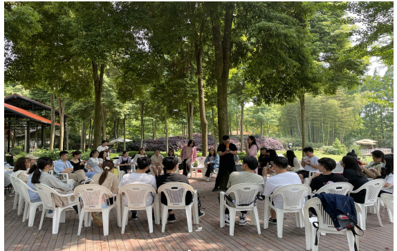
ACCA 实验班与精英培养班联动的 5 月踏青活动