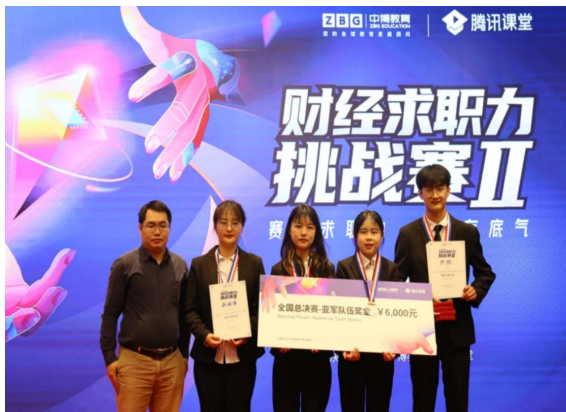
ACCA 学员获得中博财经求职力挑战赛全国亚军、西南赛区冠军