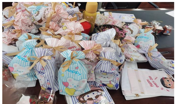
端午节师资提供方为实验班学员准备的粽子和香囊