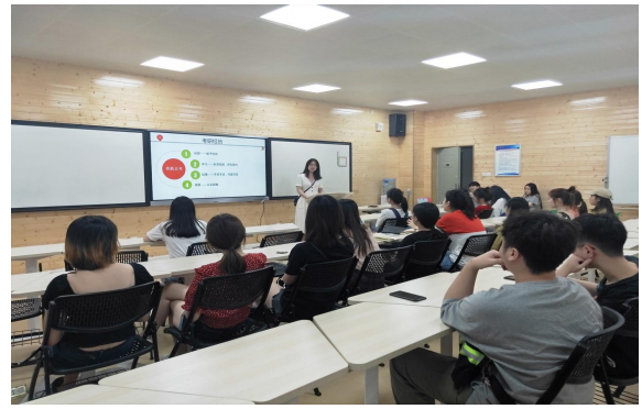
优秀学姐分享之财务管理（ACCA 实验班）专场