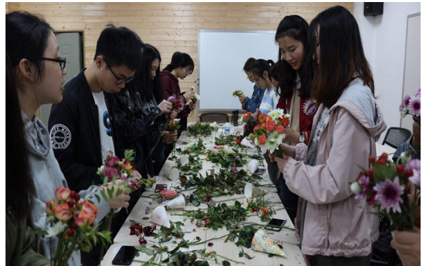
插花与艺术素养培育活动