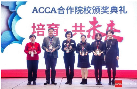
四川农业大学被授予“ACCA 优秀合作院校”