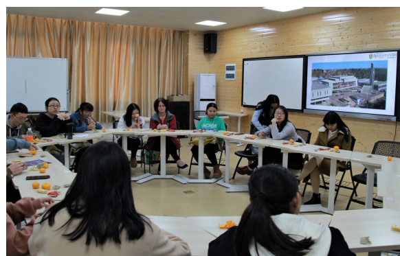
“走进亚伯” ——国际项目周系列活动之专题讲座与学习交流