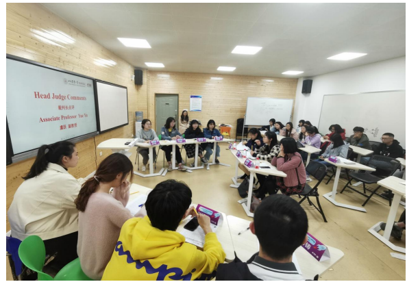
国际商务谈判之英语训练营