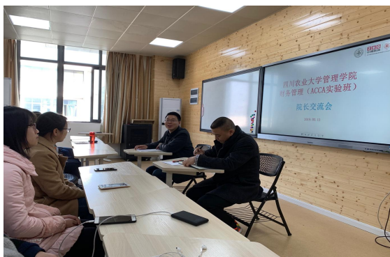
“与院长面对面”座谈会