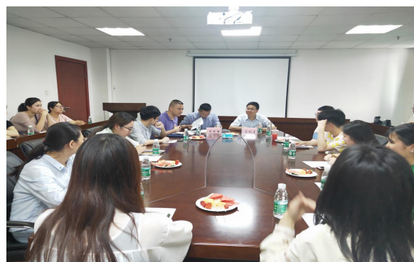
教学质量与学习恳谈会