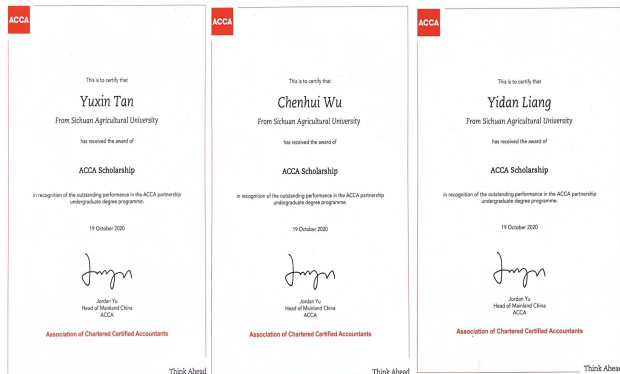
实验班学员获得 ACCA 全科通过奖学金奖状